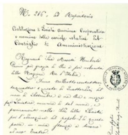
Prima pagina dell'Atto Costitutivo originale del 14/09/1884.

Oggi BpLaj è una società cooperativa per Azioni e continua a rappresentare per l'economia del territorio un indispensabile strumento di sviluppo, operando con strumenti moderni nel rispetto della missione e dei valori che furono alla base della sua nascita.